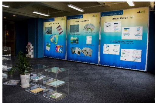
上海民办高校心理健康教育基地展室

在校园环境这一维度，以文明办、宣传部、学工部、团委等为执行主体，首先巩固文化节、科技节、体育节、读书月、军训营、心理健康教育、跆拳道等震旦特色的文化品牌。每个校园文化品牌指定专人负责，做好建设方案，学校在资金等各方面给予支持，切实把校园文化品牌建设成为提高学生人文素养的阵地。