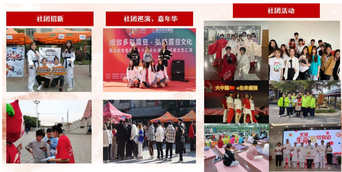
社团汇报演出 | 青春凝聚当自强 赓续盛世新华章

规范社团管理、完善社团制度，在校党委领导下、学生社团建设管理评议委员会指导下，做好学生社团管理工作，新社团答辩、日常社团活动管理、社团骨干培训、社团年检注册工作有序推进。整合学校各类学生社团 27 个，注册社团会员 2284 人。2021 年来，以社团骨干为主力，开展了 2021 年社团文化节开幕式暨社团巡演、社团专场汇报演出、社团招新、社团嘉年华等社团活动，天使之翼社团连续十二年传承上海悦苗寄养园、罗福养老院爱心志愿行动，满天星青春健康同伴社连续三年承接中国计生协“与爱同行”青春健康高校项目等，增加社团凝聚力、向心力和成员的管理能力，展现震旦学子的蓬勃朝气，引领校园青春健康新风尚。